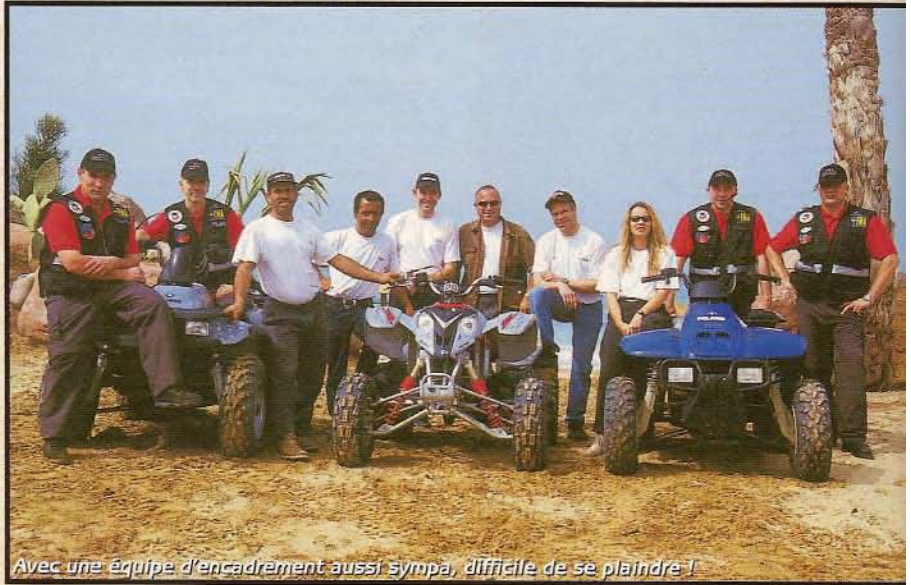
Avec une équipe d'encadrement aussi sympa, difficile de se plaindre !

Pour la randonnée en quad, n'oubliez pas d'emporter avec vous : un sac à dos, des bonnes chaussures, un duvet, des lunettes (un masque si possible), un coupe-vent léger et une bouteille d'eau. Pour vos affaires de toilette et vos recharges, c'est le 4 x 4 qui s'en charge. N'oubliez pas non plus de glisser dans votre sac un appareil photo pour immortaliser votre rando et une barre de céréales pour les petits creux. Pour le jet et le surf, pensez juste à une combinaison et une serviette de plage. Les tarifs de tous ces loisirs vont de la demi-journée à la semaine, par groupe de deux à huit personnes. L'hébergement se fait à la maison d'hôtes, ainsi que les repas, ou dans un hôtel de votre choix. Nous vous conseillons vivement « Le Palais des Roses », qui embellira votre séjour. Enfin, en ce qui concerne les formalités, il est juste nécessaire d'avoir un passeport valable six mois après votre retour.