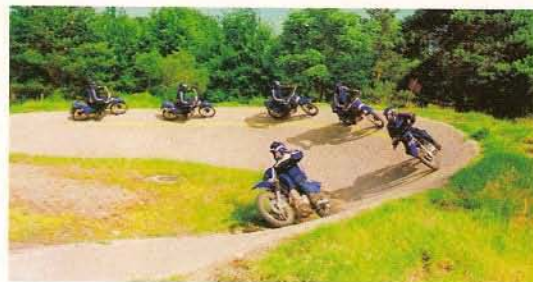
Démonstration des moniteurs de la gendarmerie nationale.

de la maniabilité à l'extrême, non sans avoir rappelé aux spectateurs que cela ne peut s'envisager en aucun cas sur route ouverte.