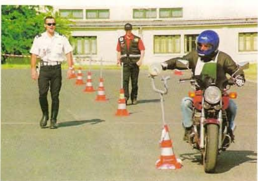
Exercice de maniabilité au camp des Loges.