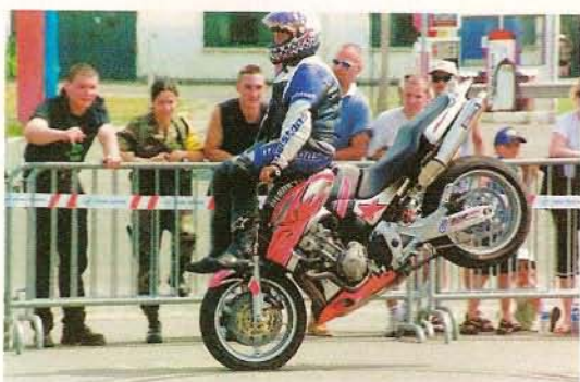
L'art de l'équilibre.