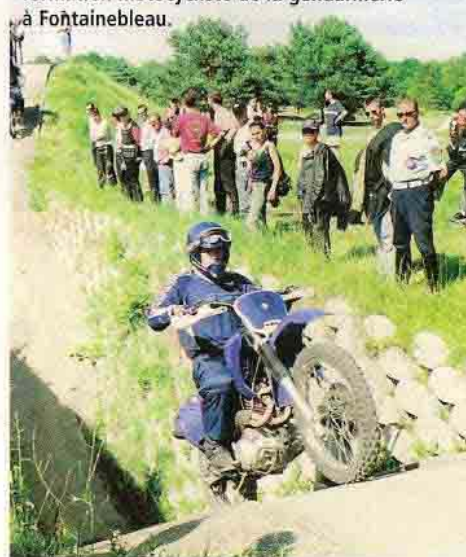
Sortie de la fosse au centre national de formation motocycliste de la gendarmerie à Fontainebleau.