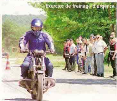
Exercice de freinage d'urgence.

Le quatrième trophée de sécurité routière des Casques d'argent, association sportive et artistique de la Brigade des sapeurs-pompiers de Paris (BSPP), se tenait les 21 et 22 juin derniers. Aux pompiers-motards, organisateurs de la manifestation, s'étaient joints les motocyclistes de la préfecture de police et son équipe d'acrobatie, ainsi que Virgil Lacroix, le célèbre cascadeur.