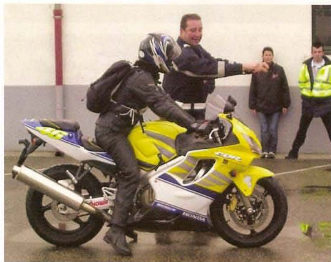
"Tendez les bras au freinage, et accompagnez la moto avec le corps!" Le formateur des motards de la police prend le temps de dispenser des conseils personnalisés à tous les stagiaires.

En ce premier jour du week-end, tous les stagiaires vont effectuer cinq ateliers : évitement, freinage d'urgence, plateau, théorie de la conduite et secourisme. Les plots, piquets et obstacles sont déjà disposés sur les parkings de la caserne, devant les camions et ambulances rouges. Malheureusement, les averses se succèdent et il faut garder la combine de pluie. Rien de tel qu'un petit freinage d'urgence sur le mouillé pour bien commencer la journée!