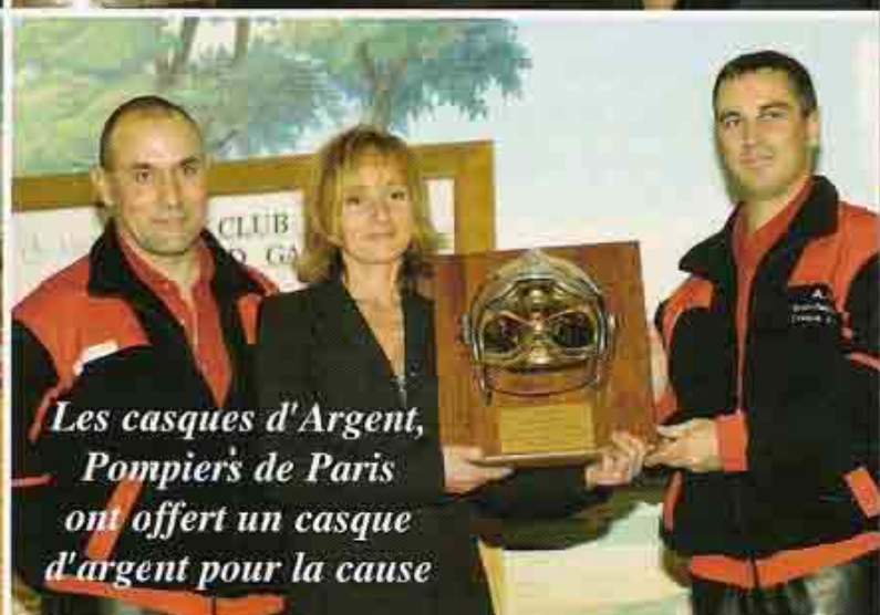
Les casques d'Argent, Pompiers de Paris ont offert un casque d'argent pour la cause