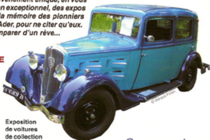
Exposition de voitures de collection

Venez costumés comme à la Belle Époque !