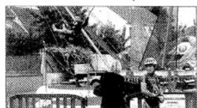
■ Le village des enfants et ses nombreuses attractions ont fait beaucoup d'adeptes.

pas sûr que les mondiaux auraient pu avoir lieu."