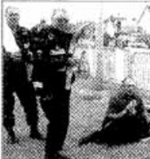
■ Petite pause pour les pompiers avant de reprendre le travail.