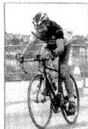
■ L'effort soutenu du contre la montre a usé plus d'un participant.